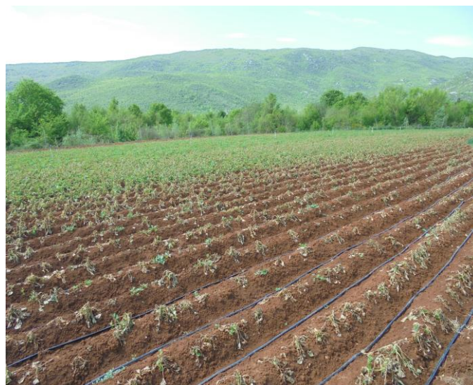
Oštećen nasad krumpira - lokalitet Veljaci