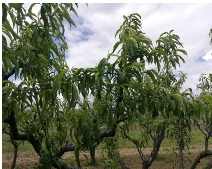
Oštećen nasad nektarina – lokalitet Klobuk