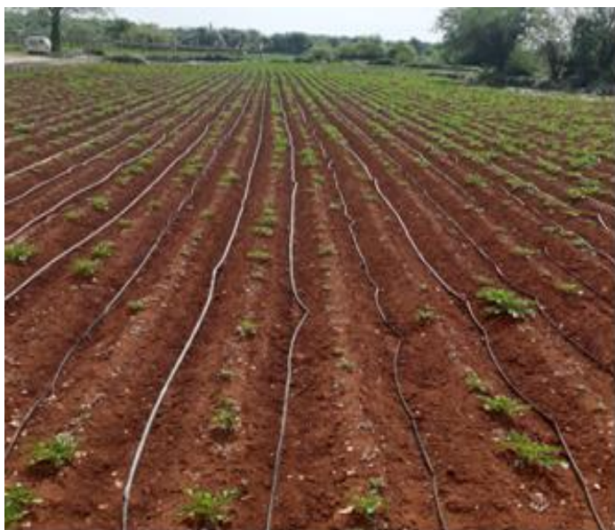
Oštećen nasad krumpira – lokalitet Vojnići