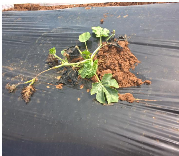
Oštećen nasad lubenice okalitet Humac