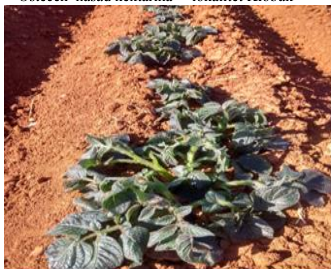
Oštećen nasad krumpira – lokalitet Vojnići